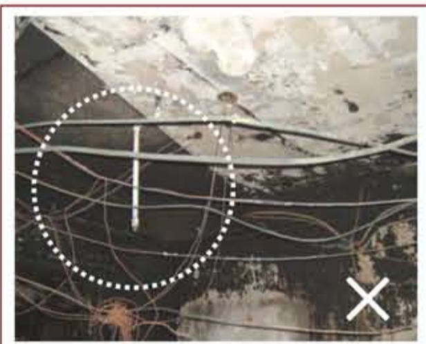
▲ 本市敦化南路某大樓第 16 樓室內裝修施工過程擅自剪斷火警警報系統並封閉灑水頭致災案例