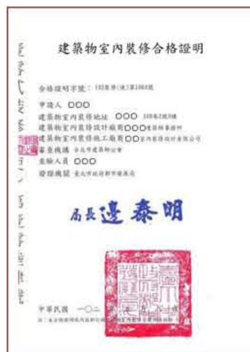
▲ 室內裝修合格證明為申請立案的必備文件

依建築法規定，建築物之用途類組變更，應申請變更使用執照，而變更使用涉及室內裝修行為者，其室內裝修應併同變更使用執照辦理。另臺北市政府基於簡政便民考量，特別訂頒「臺北市一定規模以下免辦理變更使用執照管理辦法」，惟該辦法雖放寬一定規模以下之場所（如 200 m 2 以下之補習班、幼兒園…等）得免辦理變更使用執照，但涉及室內裝修部分，仍應申請審查許可，俟領得「室內裝修合格證明」後，並經由目的事業主管機關許可後，才會核准設立登記。