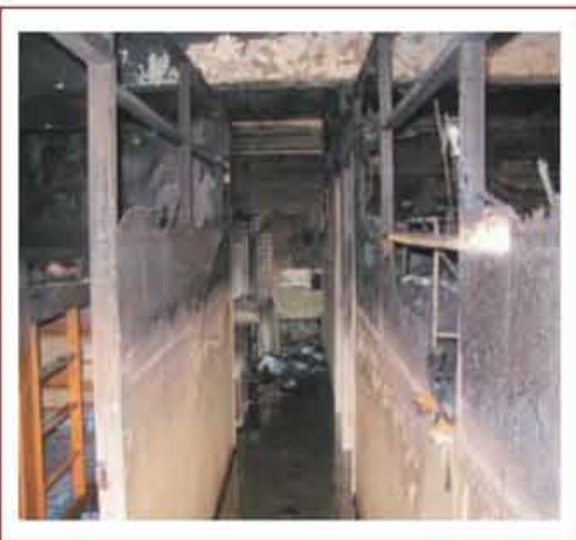
▲ 室內因大量採用易燃材料裝修而釀成鉅災案例