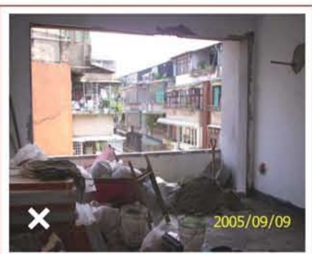
▲ 「陽臺外推」已構成違章行為，斷不能藉由室內裝修申辦程序得以合法化

室內裝修倘依法定程序申請審查許可，主管建築機關或審查機構【詳問 15】勢必就規定事項詳予審核，裝修住戶自然不會肇生「陽臺外推」【詳問 57】或「違建夾層屋」【詳問 56】等不法情事。尤其臺北市政府為了遏止違章建築行為，民國 84 年 1 月 1 日以後興建的「新違建」及「施工中違建」，建管處均採取「主動查報」、「即報即拆」策略。以往民眾常常藉由室內裝修之便，趁機把建築物原有外牆面打掉，讓陽臺向外推出去，室內空間隨之變大，這種擅自擴建的行為即屬違章建築，斷不能藉由室內裝修申辦程序得以合法化。另外，凡 95 年 1 月 1 日以後新領得建造執照的建築物，不僅禁止「陽臺外推」，而且陽臺不得加窗。消費者在購屋時，應注意自己的權益，對於建商事前的加窗設計或事後的加窗施工，都要詳加了解法律規定，以免遭受不必要的損失。