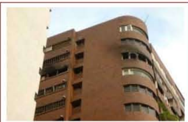
▲ 本市敦化南路某大樓第 16 樓曾因室內裝修施工過程不慎釀成大火案例

由於裝修過程常使用大量可燃、易燃材料，且動用電氣焊接等明火，若無妥善的施工安全計畫，極易造成火災，尤其素質低落的非法業者，施工人員專業知識不足，國內即曾發生多起施工過程不慎釀災的慘例。民國 92 年 6 月期間，本市敦化南路某大樓第 16 樓即因裝修過程破壞消防設備（擅自將大樓火警警報系統剪斷並封閉自動灑水頭），外加油漆工人抽煙不慎，引燃溶劑釀成大火，不僅造成多位人員死傷，屋主更因無法負擔鉅額的賠償費用，其房屋終遭法院查封，吾人當引此為借鏡。為了確保施工安全，防止施工中發生火災，消防法令業有限制一定規模以上供公眾使用建築物，於增建、改建、修建、室內裝修施工，遇有消防設備增設或移設等作業，致該設備停用或在機能上有顯著影響，或依建築物用途、構造，認有人命安全或火災預防考量之必要時，管理權人即須制訂「施工中消防防護計畫」，並向當地消防機關申報。凡依法申請室內裝修審查許可案件，建管單位均會橫向通報勞動局勞動檢查處及消防局，由權責單位督導施工業者做好各項施工中安全防護措施，以策安全。得以合法化。另外，凡 95 年 1 月 1 日以後新領得建造執照的建築物，不僅禁止「陽臺外推」，而且陽臺不得加窗。消費者在購屋時，應注意自己的權益，對於建商事前的加窗設計或事後的加窗施工，都要詳加了解法律規定，以免遭受不必要的損失。