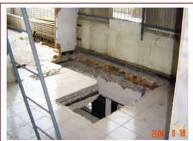
▲ 拆除樓地板涉及主要構造之變更，已逾越室內裝修管理範疇