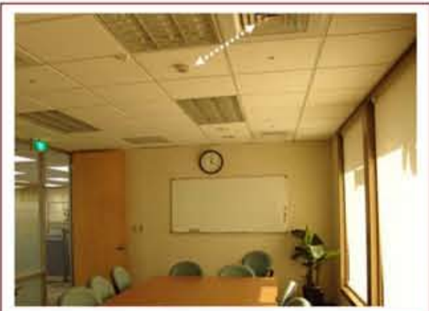
▲ 火警探測器之裝設位置錯誤案例（距離空調出風口至少應達 1.5 公尺以上）

申請室內裝修審查許可的目的，係在避免發生設計錯誤情事，實務上屢見規避室內裝修審查案件，經市民檢舉後，主管建築機關（臺北市政府都市發展局）勘查結果，發現除了違反法令規定的行政程序外，常涉有「採用易燃材料裝修」、「妨礙消防安全設備性能」、「破壞主要構造」、「擅自變更公寓大廈共用部分」等情事。類此情形，建管單位勢將援引建築法查處，並勒令裝修住戶限期改善，情節嚴重者，尚須回復原狀、修復補強，必要時請裝修住戶委託專業公會辦理結構安全鑑定。對裝修住戶而言，抱持僥倖心態規避申請審查許可，只是徒費金錢及時間。