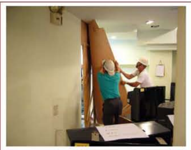
▲ 營業場所違規裝修並以易燃板材隔間，遭主管建築機關強制拆除案例

按建築法的規定，建築物室內裝修倘未依規定申請審查許可，處建築物所有權人、使用人或室內裝修從業者新臺幣 6 萬元以上 30 萬元以下罰鍰，並限期改善或補辦，必要時，並強制拆除違規室內裝修部分。因此，只要遵守法令申請室內裝修審查，即可免除被 主管建築機關 （臺北市政府都市發展局）查獲而遭受處罰的風險。室內裝修雖在室內作業，但仍難免產生施工噪音、振動或工程廢棄物等污染，市府一旦接獲市民檢舉即會派員現場勘查，如有發現具體違規事證，即可依相關法規查處，甚若發現涉有妨害公共安全情節嚴重者將執行強制拆除，以遏止不法。