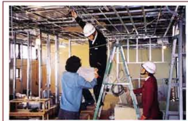
▲ 室內裝修施工期間，主管機關得隨時派員抽查並督導室內裝修有關業務

藉由室內裝修審查許可的程序，除了引導建築物所有權人、使用人委託合法登記的室內裝修從業者設計及施工外，主管建築機關更可依據「建築法」及「建築物室內裝修管理辦法」的規定，於施工過程隨時派員進行業務督導，從而督促室內裝修從業者須「按圖施工」及「限期完工」，倘發現室內裝修從業者涉有「施工材料與規定不符或未依圖說施工，經通知限期修改逾期未修改」、「由非專業技術人員從事室內裝修設計或施工業務」或「受委託設計之圖樣或說明書或其他書件經主管建築機關抽查結果與相關法令規定不符」等情事，即可檢具事證報請內政部處以「警告」或 6 個月以上 1 年以下「停業」處分，藉以整頓業界倫理，並保障裝修住戶權益，減免消費糾紛。