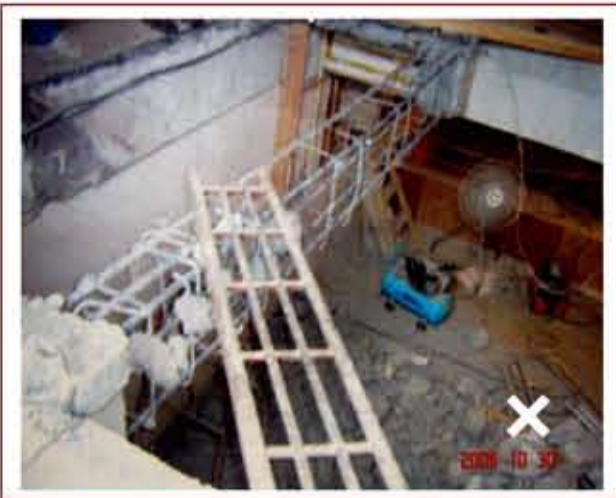
▲ 委託未經登記許可的非法業者進行室內裝修施工，肇致破壞主要構造案例

由於室內裝修的設計或施工，常涉及若干專業技術與相關法令檢討，基於公共安全考量，建築法特別規定室內裝修應委由經內政部登記許可的「室內裝修從業者」【詳問 46】辦理，而室內裝修業又須依法聘任合法登記的專業技術人員【詳問 50】始能從事設計或施工業務，從而建構完善的專業人員管理制度。因此，倘有涉及天花板、牆面、固定隔屏裝修施工或分間牆變更等「室內裝修行為」【詳問 07】，即應依法委託合法登記的室內裝修從業者辦理。不過，坊間報章雜誌充斥著許多標榜著「房屋整修」、「土木裝潢」或「壁紙油漆」的廣告，這些廣告業者往往是魚目混珠，實際上並未經內政部合法登記，假若委託無照業者辦理室內裝修，猶如緣木求魚，不僅無法依法申請審查許可，更有可能使裝修住戶陷於設計錯誤、違章建築、破壞構造等騎虎難下的窘境，消費者不可不慎。